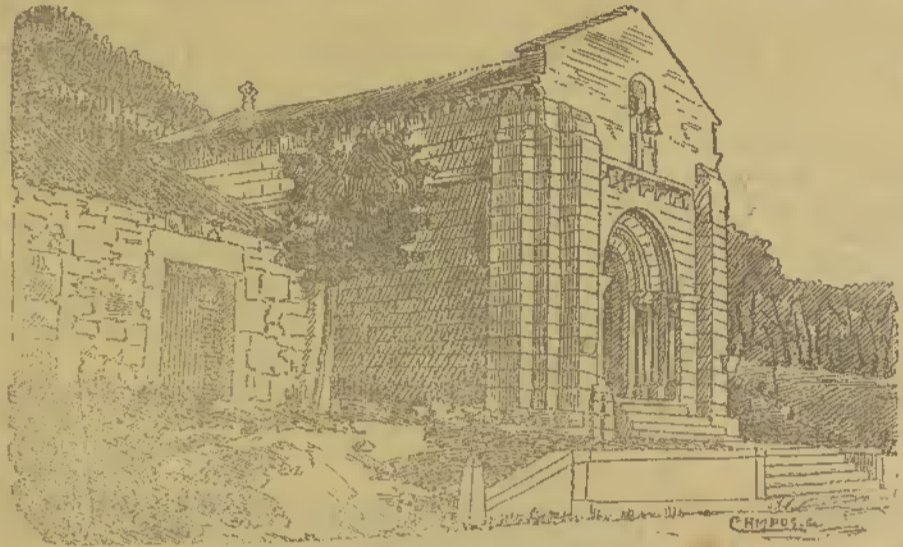
Capella da Senhora da Orada

Sulfato de cobre. —Reduz-se a pó ao acaso, um cristal de sulfato; deita-se uma pitada d'esse pó n'um copo com agua limpa que se mexe bem para se dissolver a maior parte. Depois adicionam-se algumas gotas de amonia que dará um precipitado d'uma linda cor azul celeste se o sulfato é bom. Se o precipitado for branco sujo, é por-