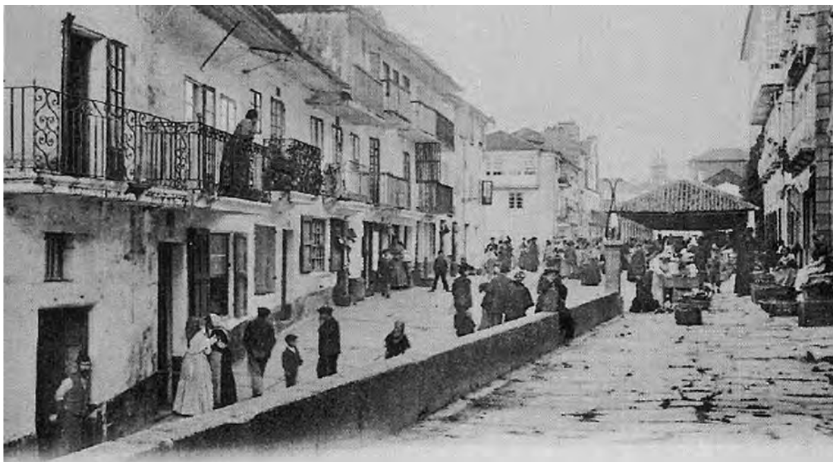
Mercado ás portas da muralla. Nel tamén se comercializaban os produtos procedentes do estraperlo. (Díaz, 2002)

de miña nai, non había outro traballo nena, nin outro traballo, nin outra comida, nin nada”.