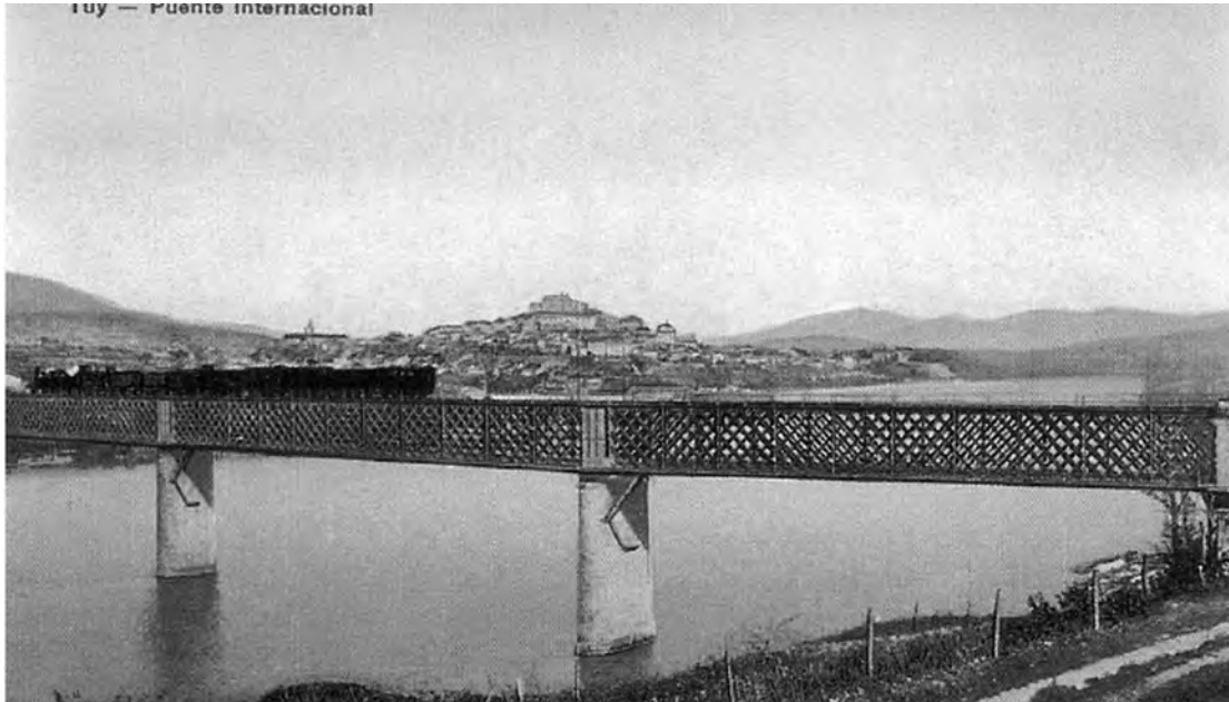
Ilustración da Ponte Internacional. Dende os primeiros momentos da súa construción este monumento estivo rodeado de grande expectación polo seu carácter revolucionario. Ó fondo apréciase o núcleo urbano. (Díaz, 2002)

resistencia campesiña canalizada a través do contrabando.